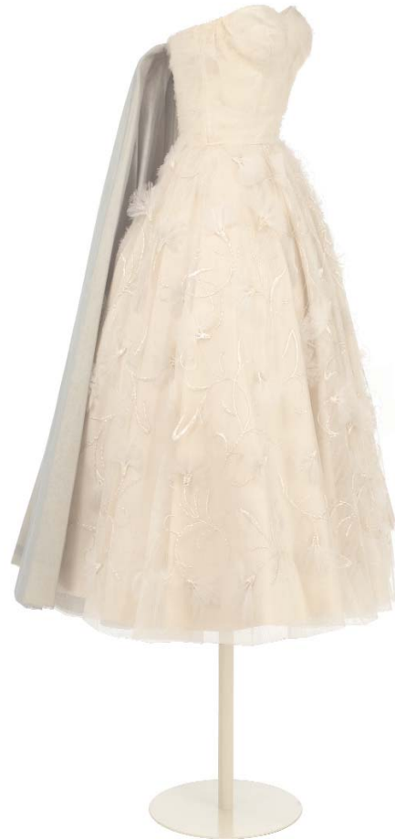
Vista lateral del traje cóctel de Pedro Rodríguez. (MT80310). Autor: Munio Rodil.

Se trata de un vestido confeccionado en la casa de Madrid de Pedro Rodríguez, entre 1950 y 1959 aproximadamente.