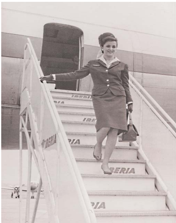
Modelo del primer uniforme diseñado para las azafatas de Iberia.

Uno de sus trabajos más destacados y que una vez más lo situaría como pionero sería el diseño de los uniformes para las azafatas de Iberia, encargo que recibiría en 1954 y que renovararía en 1962. De este modo abría la brecha que tras él seguirían en esta tarea otros creadores de moda españoles como Pertegaz, Elio