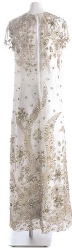
"Traje joya" de Pedro Rodríguez. (ca.) 1970 (MT93527). Autor: David Serrano.

En Iberia y sus diseñadores . Madrid, 2007.