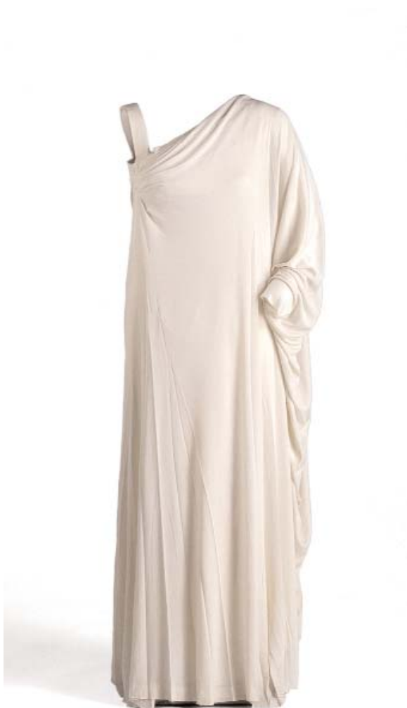
Vestido drapeado de Pedro Rodríguez. (ca.) 1955 (MT88895). Autor: Lucía Ybarra.