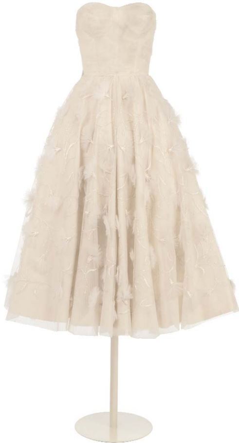
Vista frontal del traje cóctel de Pedro Rodríguez. (MT80310). Autor : Munio Rodil.