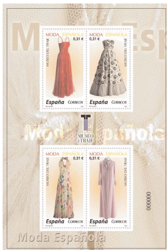
Hoja bloque de cuatro sellos con modelos de Pedro Rodríguez.

Ministerio de Información y Turismo, con la que se rendía homenaje a la Alta Costura y se reconocía la tarea de divulgación llevada a cabo por la moda española en el extranjero. En 1989, poco antes de su muerte, el Museo Textil y de la Indumentaria de Barcelona le dedica una sala con su nombre. Podemos considerar como último reconocimiento a su trabajo la presentación en 2008 de una hoja bloque de cuatro sellos con imágenes de sus creaciones, dentro de la serie denominada "Moda Española", iniciada en 2007 con la colaboración del Museo del Traje, y de la que Balenciaga había sido el primer protagonista.