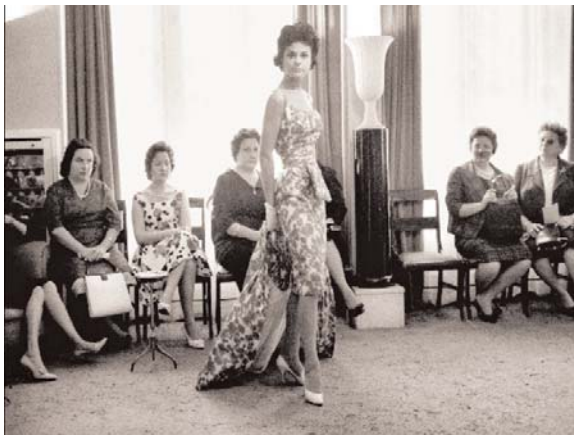
Desfile en la casa Pedro Rodríguez de la calle Alcalá de Madrid. 1959.

Costura, tenemos que remontarnos a 1858, cuando el inglés Charles F. Worth llega a la corte del III Imperio francés como sastre de la emperatriz Eugenia. Parece que fue él el primero en etiquetar los trajes que diseñaba porque los consideraba obras de arte que era necesario firmar. Hasta ese momento, la mujer que precisaba de un traje para un acontecimiento determinado acudía a la modista