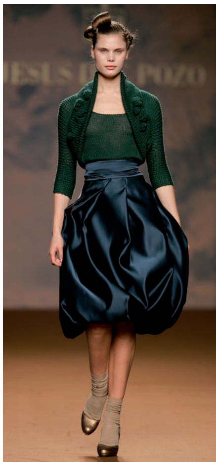
Figura 2. Torera y cuerpo verdes de punto y una falda globo de raso azul tinta. Desfile Jesús del Pozo en Pasarela Cibeles. Otoño-invierno 2005-2006.

Desde muy joven, Jesús del Pozo manifestó su inquietud por reformar todo aquello que caía en sus manos. Incansable experimentador con las posibilidades de la forma, el color, las texturas y el volumen, plegaba una y mil veces los tejidos para