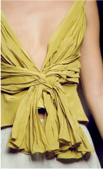
Figura 5. Cuerpo de seda arrugado color amarillo paja. Desfile Jesús del Pozo en Pasarela Cibeles. Primavera-verano 2004.