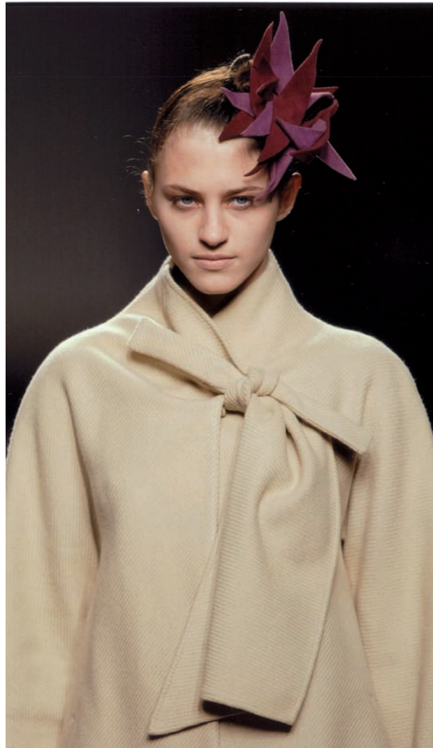
Figura 6. Abrigo color piedra con cuello de lazo. Desfile Jesús del Pozo en Pasarela Cibeles. Otoño-invierno 2004-2005.

La búsqueda intencionada del color le proporciona el resultado final a las colecciones, donde ningún color de las prendas compite entre sí. Como cualquier artista, Jesús del Pozo desarro-