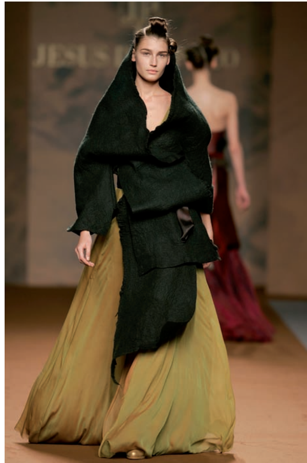
Figura 1. Cuerpo verde musgo, en lana fría, sobre un vestido verde suave en gasa reforzada con tul. Desfile Jesús del Pozo en Pasarela Cibeles. Otoño-invierno 2005-2006. Figure 1. Moss green top in cool wool, over a soft green dress in tulle-lined gauze. Jesus del Pozo catwalk at Pasarela Cibeles. Fall-winter 2005-2006.

From a very early age, Jesús del Pozo showed a particular interest in remodelling everything he laid his hands on. A tireless experimenter with the possibilities of form, colour, texture and volume, he would fold and re-fold fabrics a thousand times over in search of the poetics contained in a garment. Dreams are usually living matter, and the collections of this Madrid designer combine both spon-