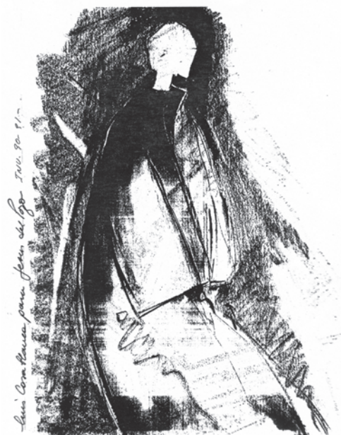
Figura 9. Dibujo de Luis Casablanca Migueles para Jesús del Pozo. Chaquetón de seda guateado. Figure 9. Drawing by Luis Casablanca Migueles for Jesús del Pozo. Quilted three-quarter length silk coat.

La vinculación con el arte se manifiesta claramente en toda su propuesta. Aunque siempre se atiene a sus propios diseños expresivos, entiende el vestido como un objeto construido como superficie, material y volumen con los que trabajar, muchas de las veces entendidos como si se tratara de un cuadro o una escultura.