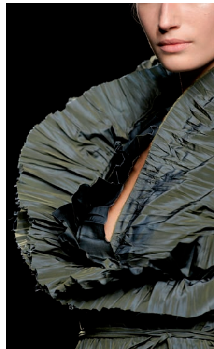
Figura 4. Cuerpo en tafeta verde tornasolada. Desfile Jesús del Pozo en Pasarela Cibeles. Otoño-invierno 2005-2006. Figure 4. Iridescent green taffeta top. Jesus del Pozo catwalk at Pasarela Cibeles. Fall-winter 2005-2006.

Nada parece lo que es, o al menos eso, en algunos casos, es lo que se pretende;