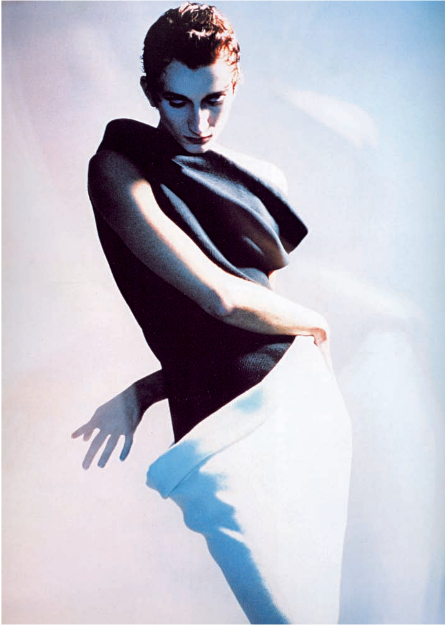
Figura 3. Vestido de punto conos invertidos. Colección primavera-verano 1988. Figure 3. Wool dress with inverted cones from the 1988 spring-summer collection.

taneity and elegance, understood as an expression of the sublime. His work embraces the parameters of pure creation, which is difficult to reconcile with the conventional trends of the fashion world.